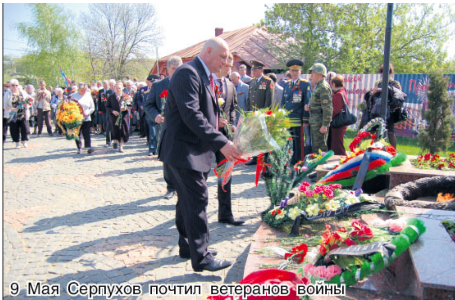
9 Мая Серпухов почтил ветеранов войны